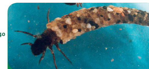
Afb. 4 - Kleine waterorganismen: de larven van de schietmot.

Tussen Vaals en de monding in Bunde maakt de Geul veel bochten. Als een rivier langzamer stroomt en de bodem uit fijn materiaal bestaat (leem, klei of zand), kunnen “lussen” ontstaan, die we ook wel meanders noemen. Hieraan kun je goed zien dat de rivier zich “natuurlijk” ontwikkelt en niet door de mens in een rechte baan geleid wordt. Is de Geul nu een rivier of een beek? Laten we het zo zeggen: een riviertje!