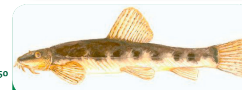
Afb. 5 - Grotere waterorganismen: het biermpje.