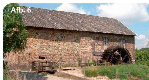
Afb. 6 “Motoren uit de oude tijd”: net als de Volmolen bij Epen zijn veel oude molens tegenwoordig beschermd monumenten.