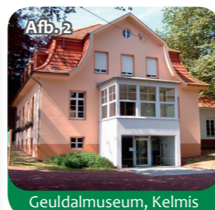
Afb. 2 Geuldalmuseum, Kelmis

Tot aan de monding stroomt de Geul door drie grotere plaatsen, waar je tijdens een wandeling veel kan ontdekken: Kelmis en Moresnet in België en Valkenburg in Nederland. In Kelmis ligt de Eyneburg, een oude ridderburcht die volledig gerestaureerd werd. In het oude pelgrimsoord Moresnet stroomt de Geul onder één van de oudste en langste spoorbruggen van Europa (afb. 3).